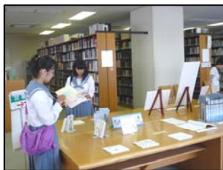
司書課程コーナー