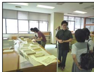
アーキビストコーナー