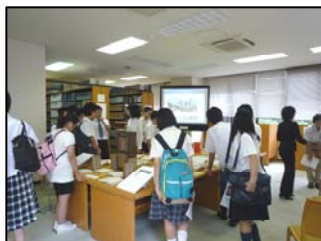
教職課程コーナー