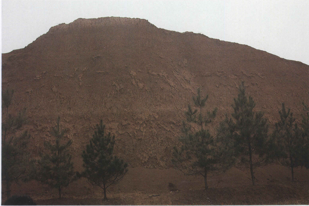
公王嶺発掘地点全景