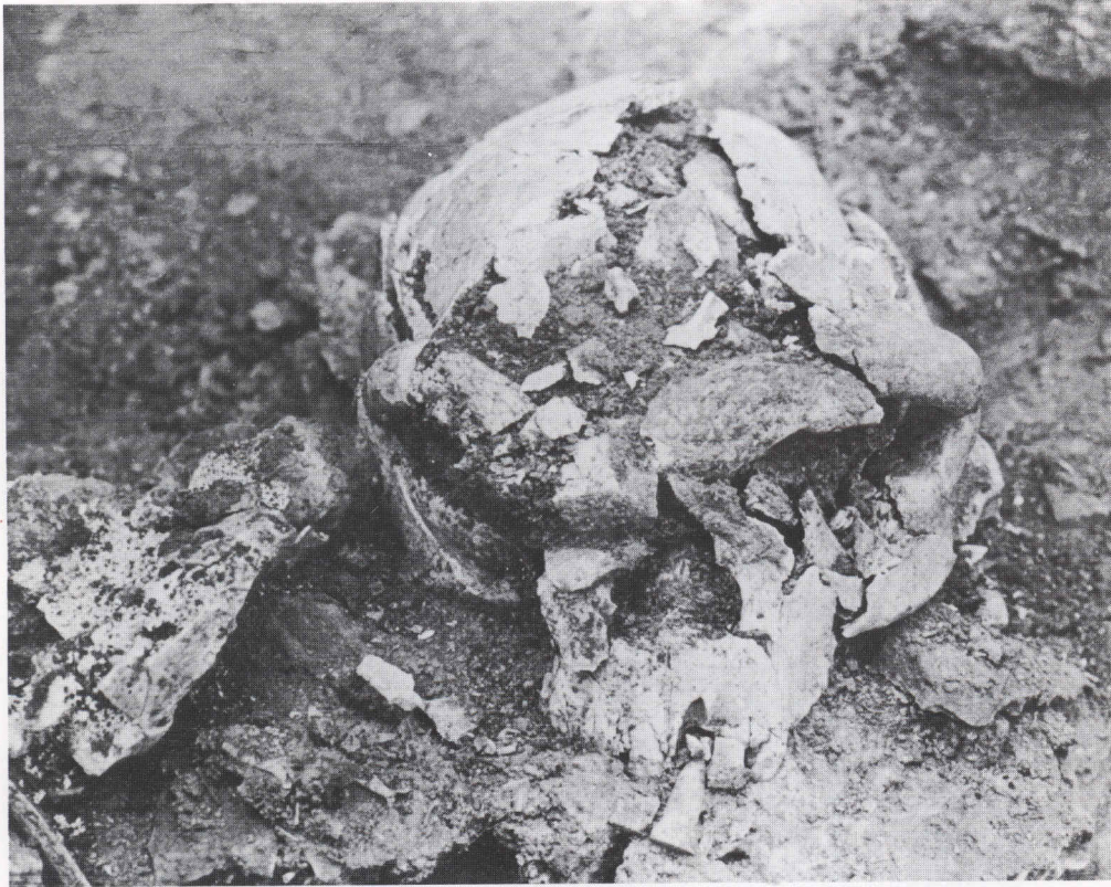
金牛山人頭骨化石

中国遼寧省金牛山の洞穴で発見された化石人類。発見は1984年9月27日、化石には頭骨のほか、脊椎骨、四肢骨がふくまれ、多くの動物化石が伴出した。