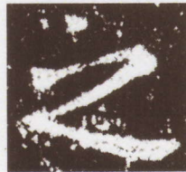
蘭亭序 (張金界奴本)