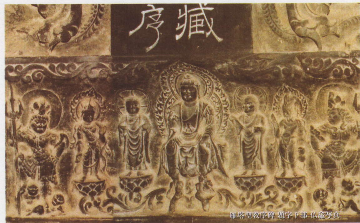
雁塔聖教序碑 題字下部 仏像写真