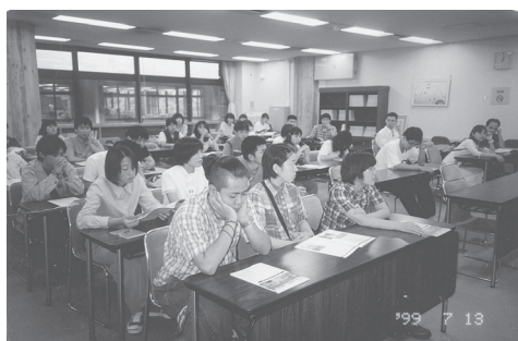
研修室で総合説明を受ける（国立国会図書館）