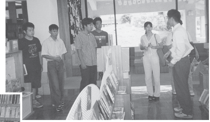
伊万里市民図書館で 先輩の説明を聞く