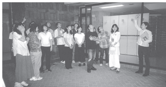
地下8F建ての書庫の底から、はるか上方の明かり窓を見る （国立国会図書館）