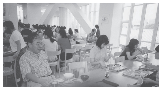
味はなかなかのもの （国会図書館のレストランで昼食）