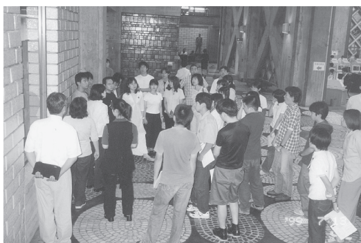
館内の説明に耳を傾ける（国会図書館）