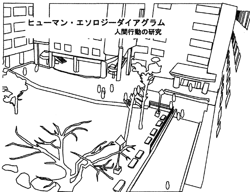
「ヒューマン・エソロジーダイアグラム」～人間行動の研究～