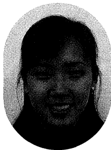
「視覚感カードの絵本」