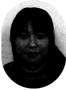
「江戸の化粧」 ～日本の心・美の探求～