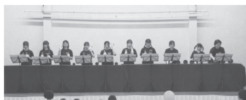
【玖珠子どものひろば出演】

2年間学生たちは実践的な場を持つこと、短い時間で行事や訪問の計画を立てること、学年を超えた仲間と協力することなど講義だけでは経験できない多くの経験を積むことができた。楽器演奏だけでなく、楽器の運搬や片付け、子どもたちへの声掛けや楽譜配置、すべてにおいて今後役立つ実践的活動であったと言える。顧問が伝えることはほんの一粒、それをどこまで自分自身の物とすることが出来るか、今後の挑戦におおいに期待したい。