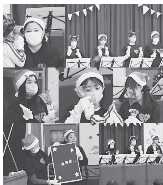
【幼稚園への訪問活動】